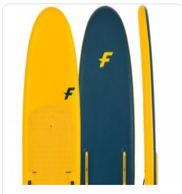
F-ONE BOARD ROCKET-AIR