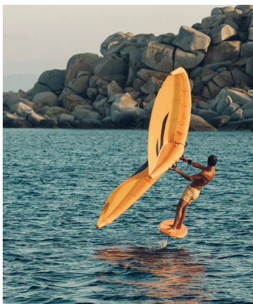
DÉCOUVRE LE WING FOIL