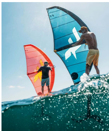
ÉQUIPÉ PAR F-ONE