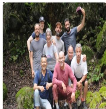
Fil d'Air UNE TEAM DE PASSIONNÉS POUR T'APPRENDRE

Pour plus d'information, rendez-vous ici : https://www.captainwild.com/sejours/wing-surf-camp-fone/