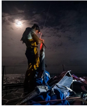
QUART DE NUIT, TRAÇAGE DE ROUTE ET MANOEUVRES