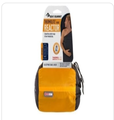
SEA TO SUMMIT SAC THERMOLITE REACTOR OFFERT