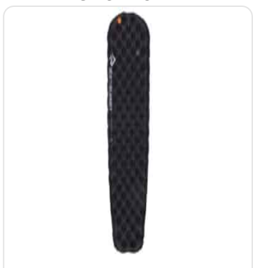
SEA TO SUMMIT