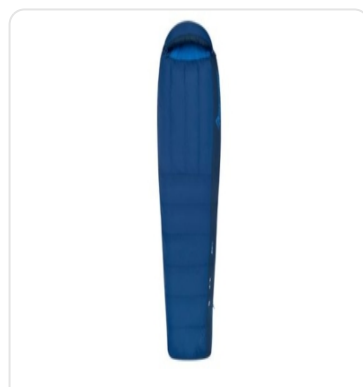
SEA TO SUMMIT DUVET TREK TKII