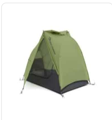
SEA TO SUMMIT TENTE ALTO TR2 ULTRALIGHT