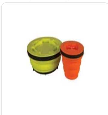
SEA TO SUMMIT