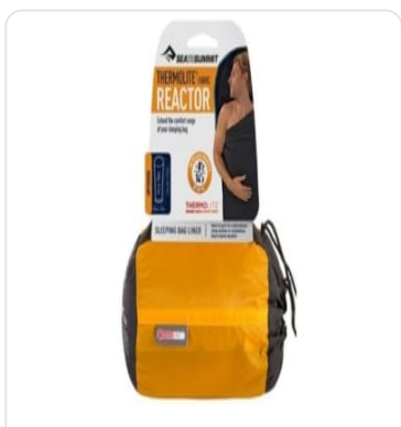
SEA TO SUMMIT SAC THERMOLITE REACTOR OFFERT