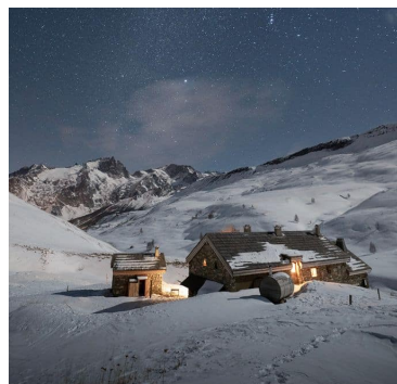
NUIT EN REFUGE SUR LE PLATEAU D'EMPARIS