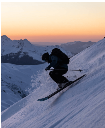
2 JOURS SKI DE RANDONNÉE ITINÉRANT