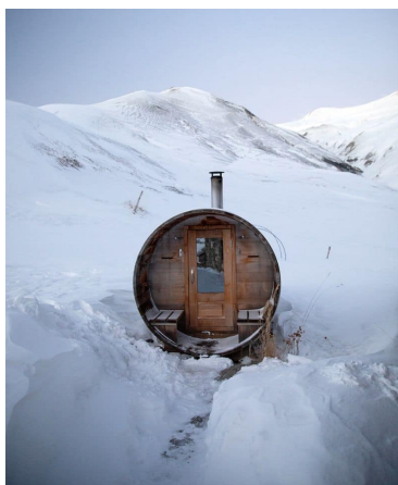
SAUNA FINLANDAIS DÉTENTE FIN DE JOURNÉE