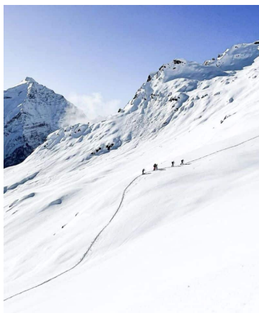
MASSIF DES ÉCRINS AU DÉPART DE LA GRAVE