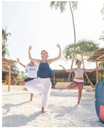
COURS DE YOGA SUR LE SABLE ÉTIREMENT ET ÉVEIL MUSCULAIRE