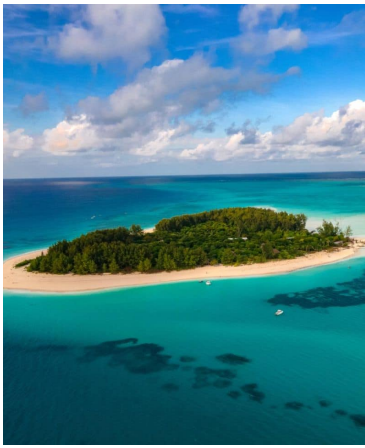
SNORKELLING & CHILL SUR L'ATOLL DE MNE MBA