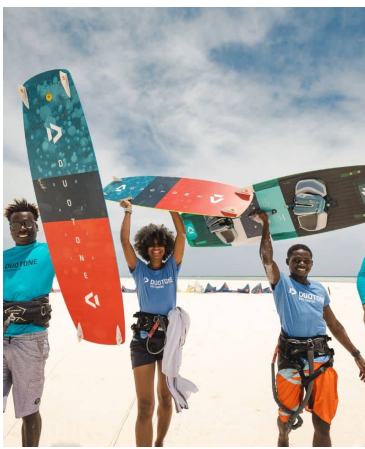
IMAGINÉ ET ÉQUIPÉ AVEC DUOTONE