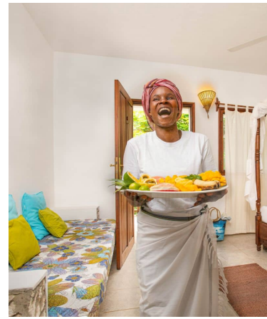
ACCUEIL CHALEUREUX & NOURRITURE LOCALE