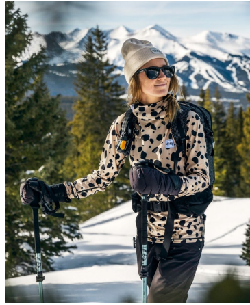
EQUIPÉ PAR LA TEAM EIVY