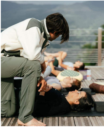
SESSIONS YOGA ET ROOFTOP AVEC VUE