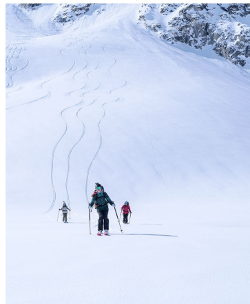
SUR UN ITINÉRAIRE ALTERNATIF PLUS SAUVAGE ET PENTU