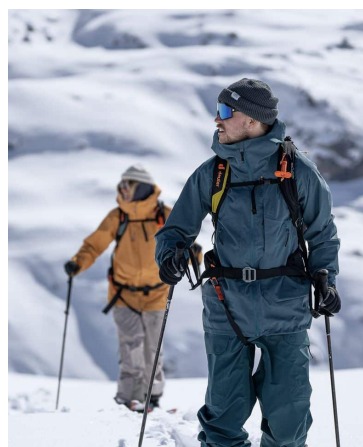
ÉQUIPÉ PAR LA TEAM DEUTER AVEC LEURS SACS AIRBAG