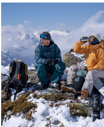
FREERIDE SUR UN SPOT CHAMONIARD