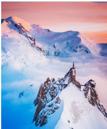
TOP VIEW DEPUIS L'AIGUILLE DU MIDI