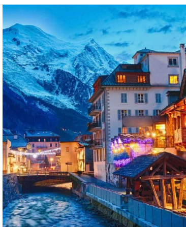
AU COEUR DE L'ESPRIT DE CHAMONIX