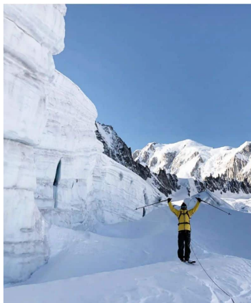
TRACE LA VALLÉE BLANCHE EN SKI FREERIDE